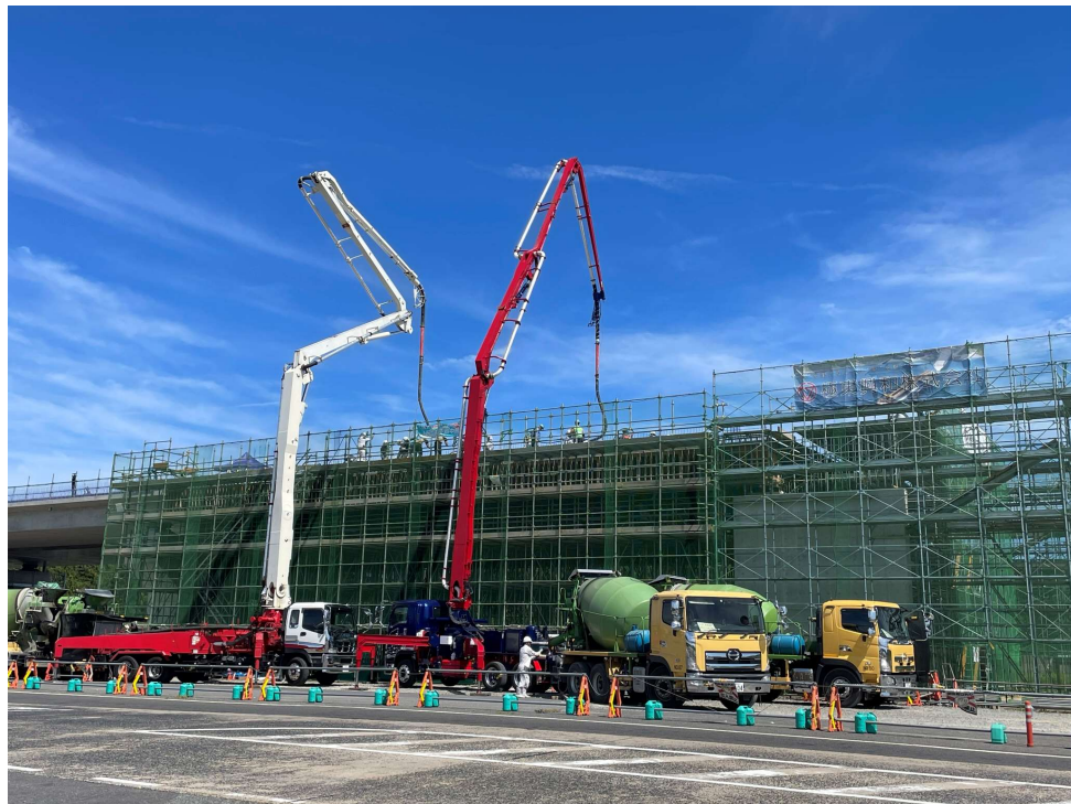
第6回 最優秀賞「青空と白・赤のコンクリートポンプ車」