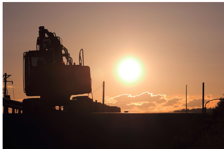
第6回 優秀賞「きつと、あしたはいい天気。」

最優秀賞(1点)賞状、図書カード1万円 優 秀 賞(2点)賞状、図書カード5千円 入 賞(9点)賞状、図書カード3千円 全員共通 入賞作品オリジナルカレンダー2025