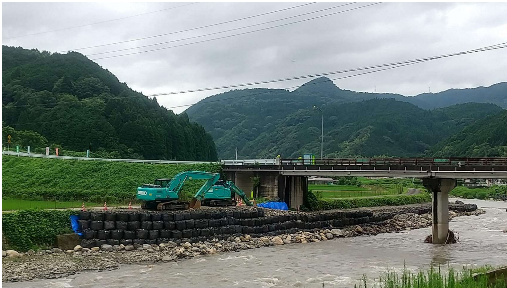
撮影場所(鳥取市佐治町 佐治川 刈地橋の下)