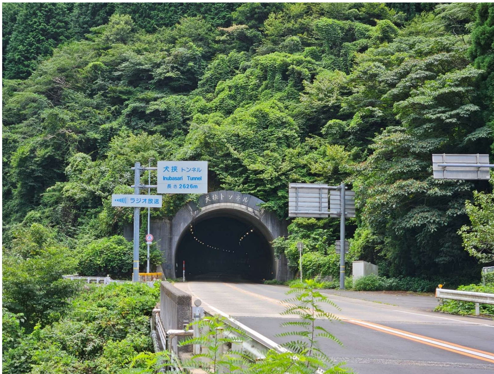
撮影場所(倉吉市関金町 犬狹トンネル)