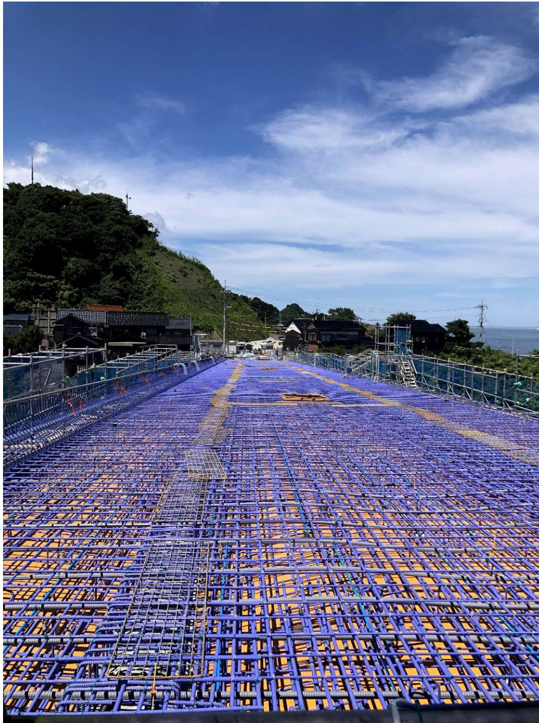
撮影場所(岩美町田後 田後高架橋の建設現場)