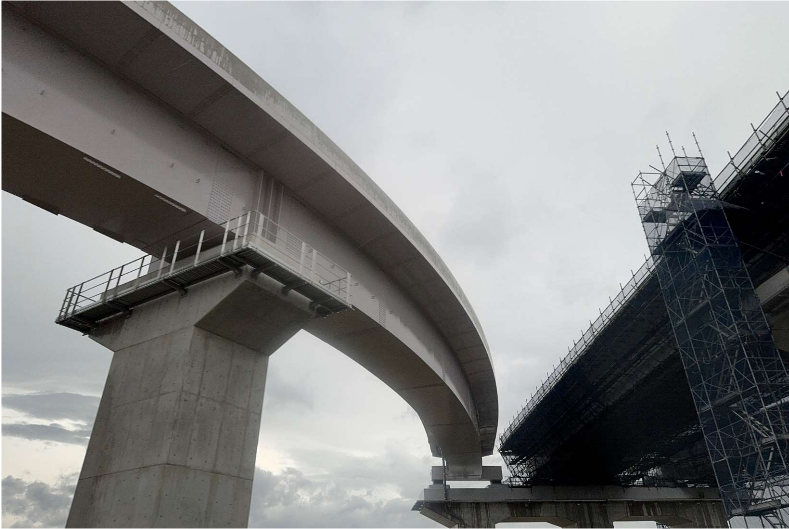
撮影場所(北栄町 北条ジャンクション)