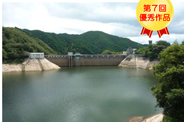
「米子の水がめ 菅沢ダム」

作品募集 テーマ: ちいき 地域の安全と あんぜん 暮らしを守る建設のしごと 対 象: とっとりけんないざいじゅう 鳥取県内在住の小学生、中学生