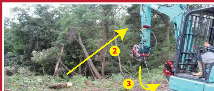
アームで対象を引き寄せ、たるんだワイヤーを巻き取ります。

シンプル構造なので導入&メンテナンスも安価 2台目・3台目・予備の設備などにも最適です！