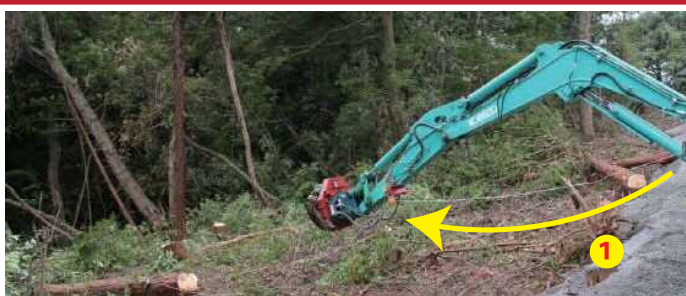
対象にワイヤーをかけ、アームを伸ばします。