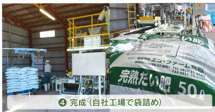
④ 完成 (自社工場袋詰め)